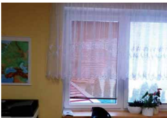
Oprava kanceláře účetní na OÚ - osazení nového okna