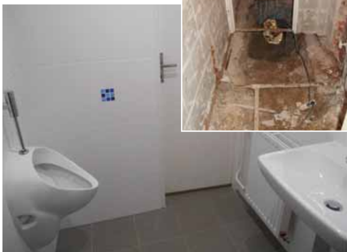
Oprava WC v přízemí OÚ