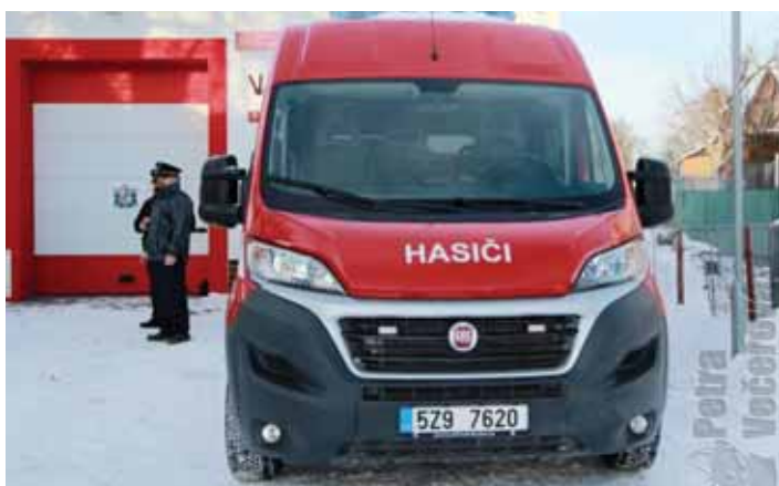
Pořízení nového DA z dotací zlínského kraje a Ministerstva Vnitra