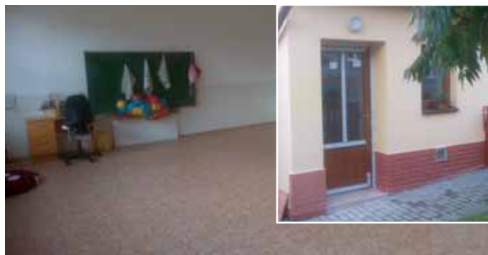
Opravy v MŠ: osvětlení, vymalování, podlaha, kryty radiátorů, dveře do kuchyňky