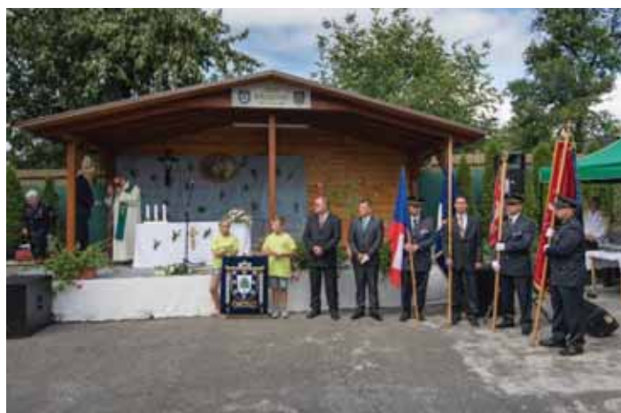
Oslavy 610 let obce pod názvem: „Den obce“