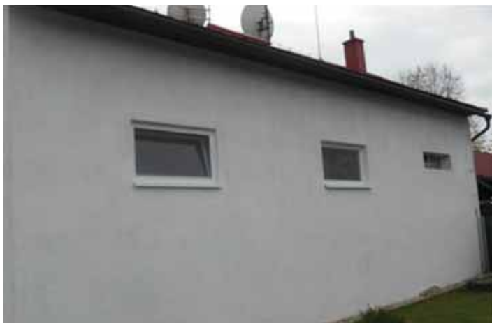
Výměna oken na zbrojnici