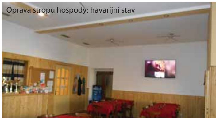
Oprava stropu hospody: havarijní stav