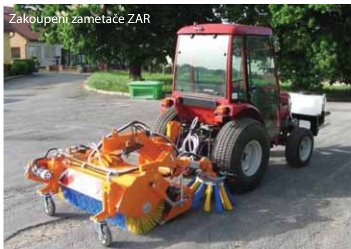
Zakoupení zametače ZAR