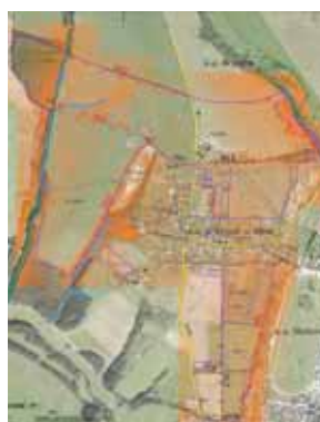
Komplexní pozemkové úpravy obce Březová