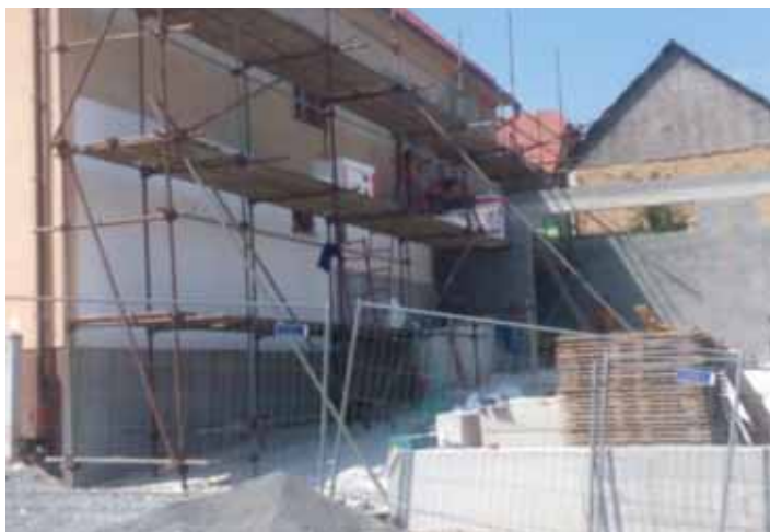
Fasáda zadní části OÚ - nové zateplení