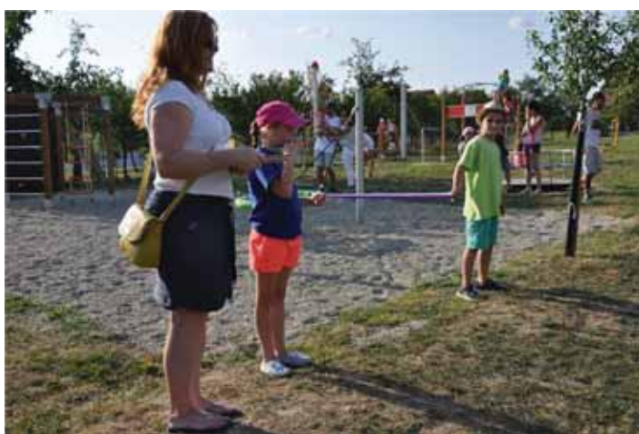
Slavnostní otevření klubovny TJ Sokol