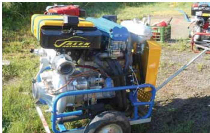
Nové požární čerpadlo