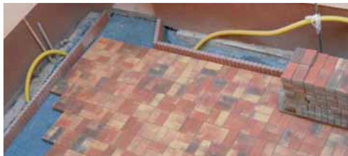
Dvorek obecního úřadu