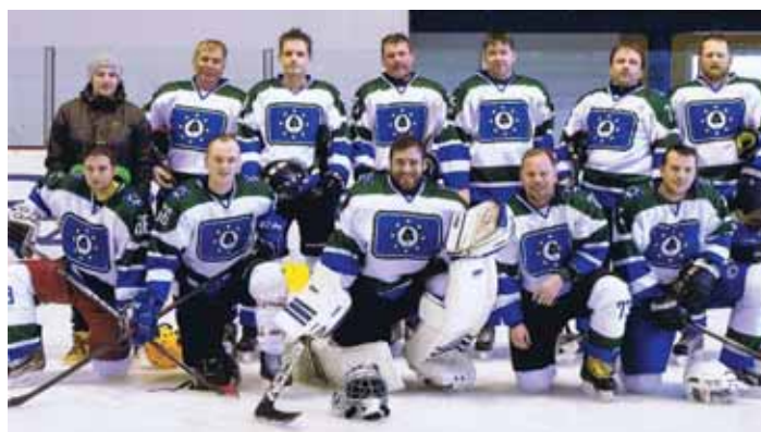
Zakoupení dresů pro hokejové družstvo z Březové