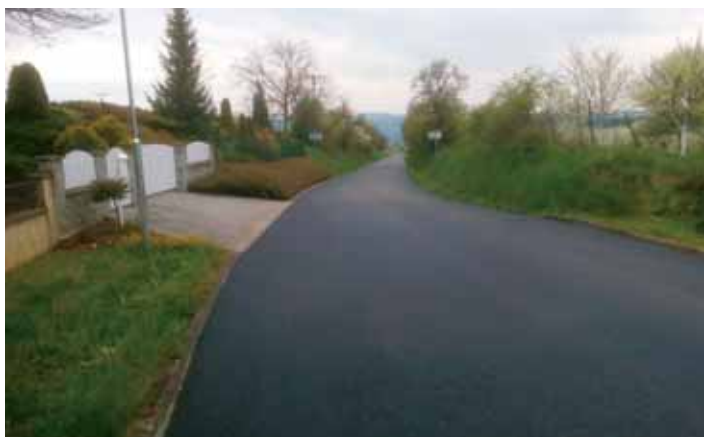
Oprava cesty v uličkách – hrazeno z rozpočtu ŘSZLK