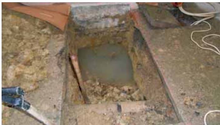
Zrušení septiků ve dvoře OÚ a řízený protlak pod budovou OÚ