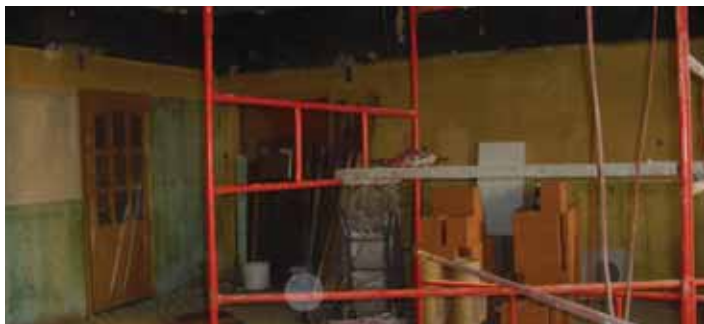
Oprava stropu hospody