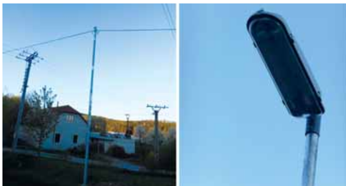
Osvětlení zastávky Nové Dvory