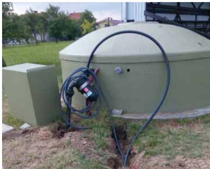
Přívod vody pro zavlažování hřiště TJ SOKOL z požární nádrže na Luži pro zásobník na závlahu hřiště