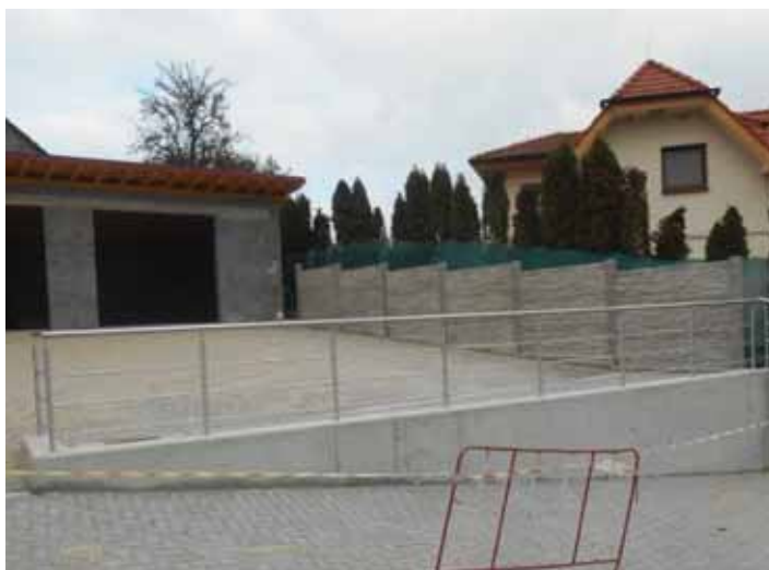
Dodělení plotu a zábradlí u OÚ